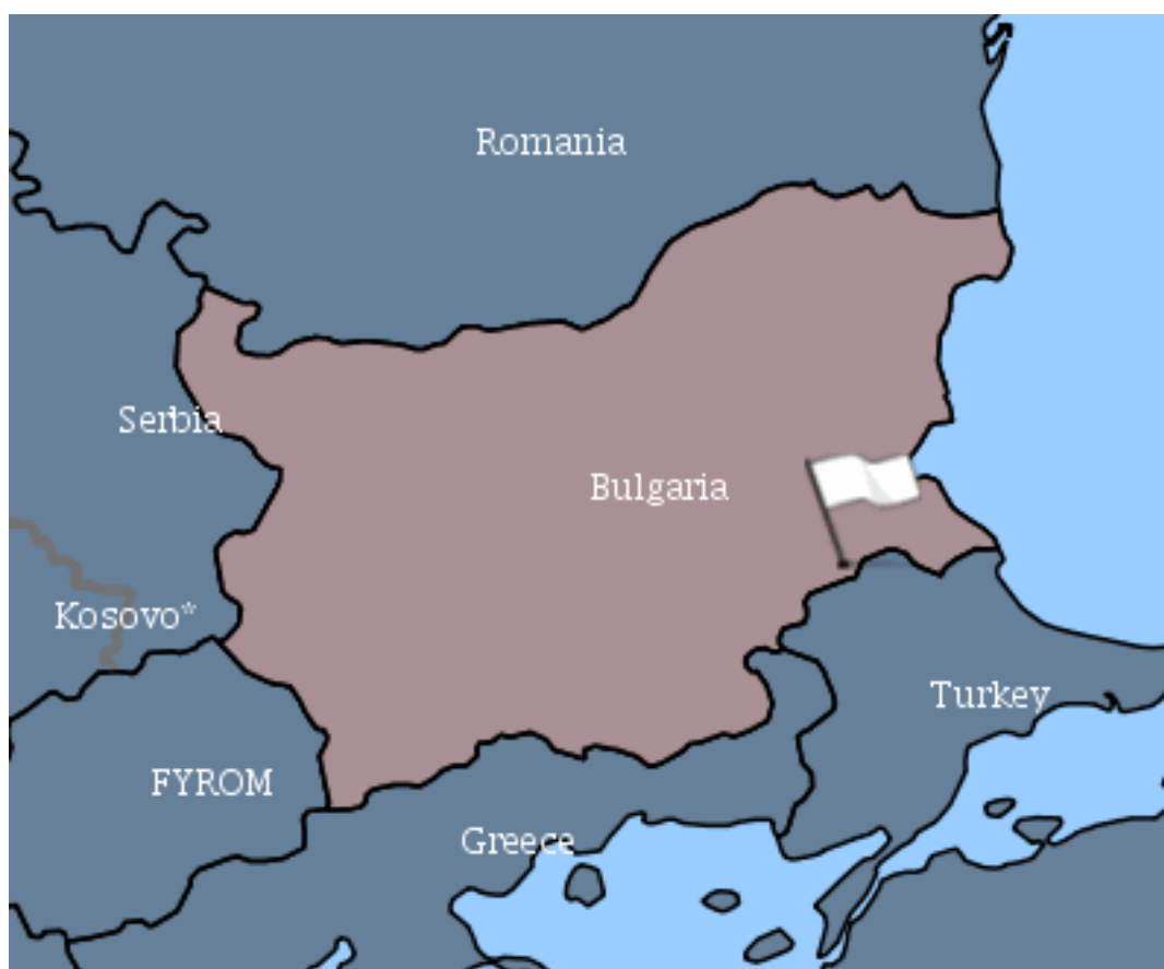
Εικόνα 1. Εστία Πανόλους Μικρών Μηρυκαστικών στη Βουλγαρία (village Voden, Municipality Bolyarovo, Region Yambol).

B. Οι Κτηνιατρικές Υπηρεσίες των νησιών απέναντι από τα Παράλια της Τουρκίας παρακαλούνται να προβούν άμεσα στις παρακάτω ενέργειες: