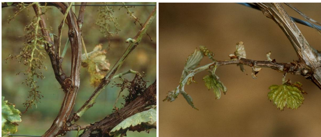
Εικ. Χαρακτηριστικά επιμήκη έλκη της ασθένειας σε κληματιδες./Προσβεβλημένος τρυφερός βλαστός.

Προκαλεί ξηράνσεις κεφαλών και βραχιόνων, με αποτέλεσμα τη σταδιακή εξασθένηση των πρέμνων και την έξοδό τους από την παραγωγή. Τα συμπτώματα της ασθένειας είναι ορατά με την έναρξη της βλάστησης. Ορισμένες κεφαλές του προσβεβλημένου πρέμνου δεν βλαστάνουν ή δίνουν ασθενικούς βλαστούς που αποξηραίνονται αργότερα. Συνήθως η προσβολή εντοπίζεται προς τη μία πλευρά του πρέμνου. Ευπαθείς στις μολύνσεις είναι οι τρυφερές κληματιδες μέχρι μήκους 10 εκ. Η μετάδοση της ασθένειας ευνοείται από βροχερό καιρό και σε μεγάλο θερμοκρασιακό εύρος (0°C–30°C). Μεγαλύτερη ευπάθεια στη βακτηρίωση παρουσιάζουν οι ποικιλίες Σουλτανίνα και Ραζακί.