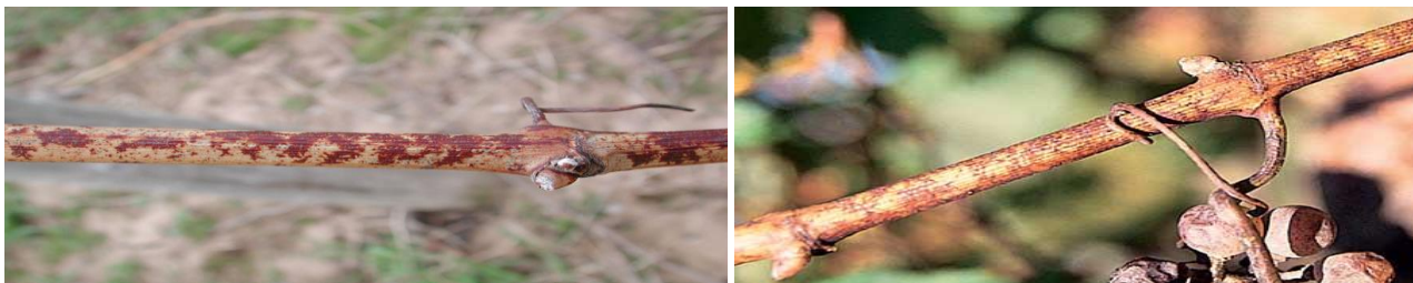
Εικ. Χαρακτηριστική προσβολή κληματιδών από ωίδιο.

2. ΩΙΔΙΟ. Ο μύκητας διαχειμάζει με τη μορφή μυκηλίου στους οφθαλμούς των προσβεβλημένων κληματιδών, καθώς και με τη μορφή κλειστοθηκίων στην επιφάνεια των προσβεβλημένων κληματιδών και των φύλλων. Ο χαλκός συμβάλλει την καταστροφή των κλειστοθηκίων.