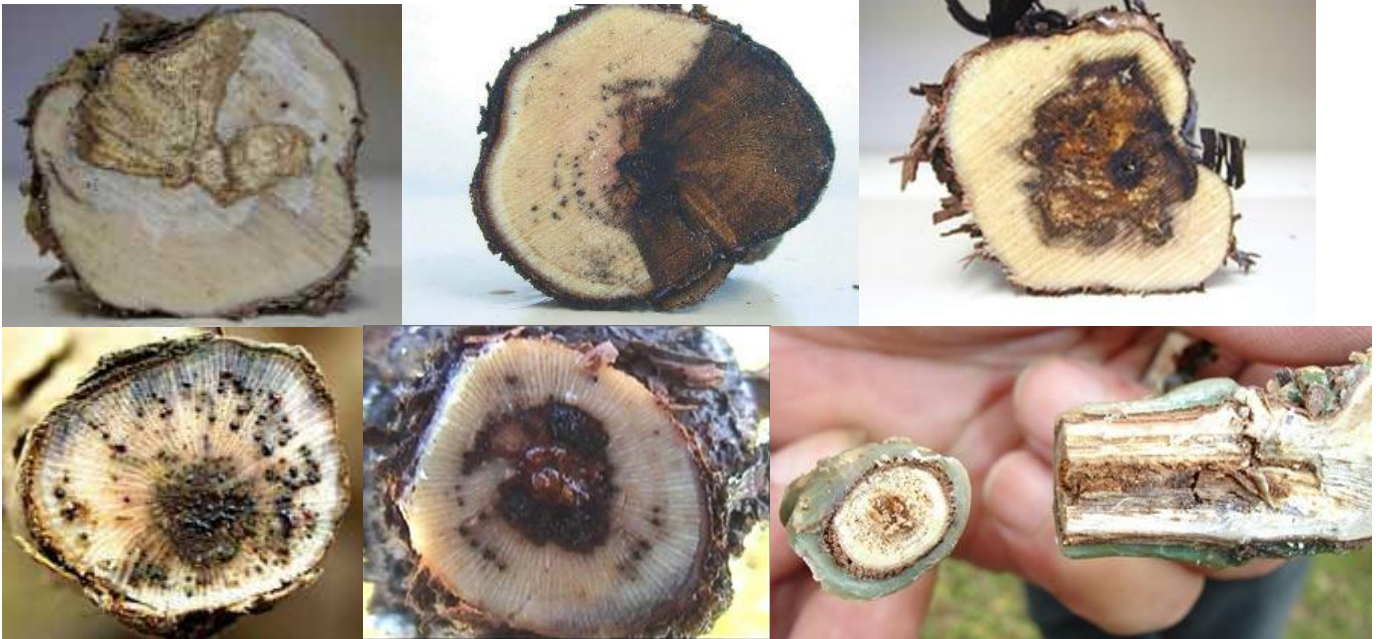
Εικ.. Τομές βραχιόνων και κληματίδων με χαρακτηριστικά συμπτώματα προσβολής από μύκητες του ξύλου (μεταχρωματισμοί και αλλοιώσεις). Η διαπίστωση τέτοιων συμπτωμάτων κατά τη διαδικασία του κλαδέματος, πρέπει να κινητοποιήσει άμεσα τους αμπελουργούς.