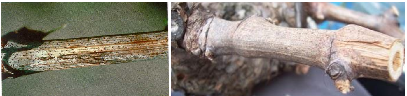
Εικ. Χαρακτηριστική προσβολή κληματίδων από φόμοψη—μακρόφωμα.

1. ΦΟΜΟΨΗ—ΜΑΚΡΟΦΩΜΑ. Πρόκειται για μυκητολογικές ασθένειες που προκαλούνται από συγγενείς μύκητες, οι οποίοι διαχειμάζουν υπό μορφή πυκνιδίων στην επιφάνεια των προσβεβλημένων κληματίδων. Για το λόγο αυτό, οι προσβεβλημένες κληματίδες πρέπει να απομακρύνονται άμεσα και να καίγονται. Ο χαλκός συμβάλει την καταστροφή των πυκνιδίων.