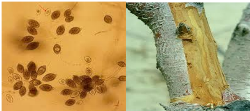
Προσβολή από φυτόφθορα

Ο μύκητας μεταδίδεται από το έδαφος στο λαιμό του δένδρου και ευνοείται από την ύπαρξη τραυμάτων στο σημείο εμβολιασμού ή στις ρίζες των δένδρων. Η ζημιά εκδηλώνεται αργά την άνοιξη την εποχή της έναρξης της βλάστησης. Τα δένδρα σταματούν να βλαστάνουν, τα φύλλα τους γίνονται μικρά, χλωρωτικά και προοδευτικά παρατηρούνται ξηράνσεις κλάδων, βλαστών και όταν είναι μικρά ξηραίνονται. Η ασθένεια ευνοείται από την υψηλή υγρασία που ενδέχεται να υπάρχει κοντά στο λαιμό του δένδρου.