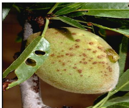
Συμπτώματα κορύνεου σε φύλλα (τρύπες από σκάγια), βλαστό και καρπό