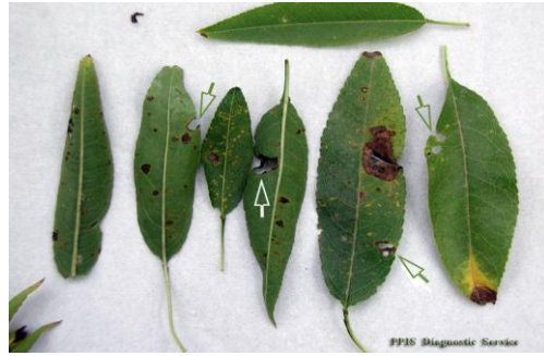
-Προσβολή φύλλων από κερκόσπορα

Η ανθράκωση προκαλεί συμπτώματα παρόμοια με το κορόνιο. Προσβάλλει τα φύλλα τους βλαστούς και τους καρπούς. Στους καρπούς προκαλεί καστανές βυθισμένες κηλίδες, οι ιστοί του πράσινου περικάρπιου ξεραίνονται ενώ οι ιστοί του ξυλώδους ενδοκαρπίου σαπίζουν.