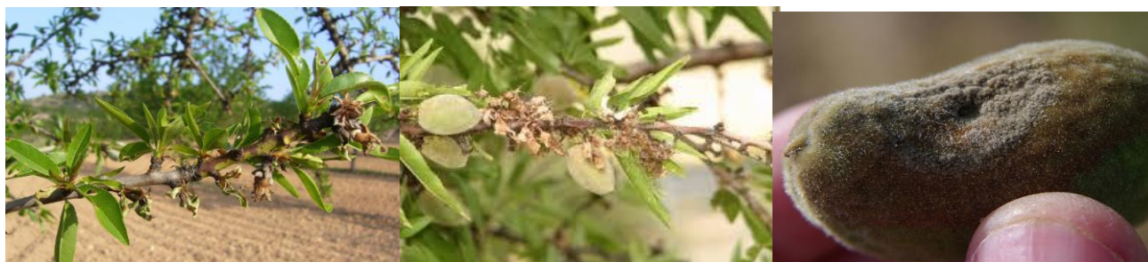
Συμπτώματα μονιλίας σε βλαστούς και καρπό αμυγδαλιάς

Ο μύκητας διαχειμάζει στα έλκη, στους μουμιοποιημένους καρπούς και στους αποξηραμένους κλάδους.