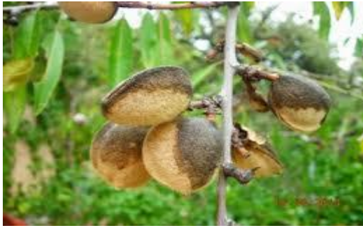
Προσβολή από Ανθράκωση