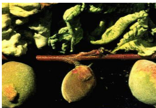
Συμπτώματα εξώασκου σε φύλλα και καρπούς αμυγδαλιάς

Μυκητολογικές ασθένειες που προσβάλλουν τα φύλλα, τα άνθη και στη συνέχεια και τους καρπούς.