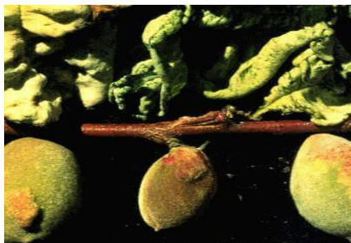
Εικόνα 3 Συμπτώματα εξώασκου σε φύλλα και καρπούς αμυγδαλιάς

Μυκητολογικές ασθένειες που προσβάλλουν τα φύλλα, τα άνθη και στη συνέχεια και τους καρπούς.