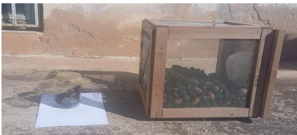
Γυάλινο βάζο και κλωβός του Π.Κ.Π.Φ Βόλου με προσβεβλημένα αμύγδαλα

Το ευρύτομο διαχειμάζει στο στάδιο της αναπτυγμένης προνύμφης μέσα στους προσβεβλημένους καρπούς, οι οποίοι παραμένουν μουμιοποιημένοι επάνω στα δένδρα ή βρίσκονται πεσμένοι στο έδαφος.