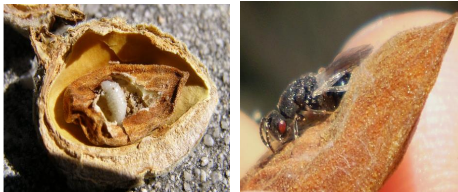
Προνύμφη Ευρυτόμου και τέλειο εξερχόμενο από τον καρπό όπου νυμφώθηκε

Για την ορθολογική αντιμετώπιση του ευρυτόμου συνιστάται στους καλλιεργητές να συλλέγουν αυτές τις ημέρες προσβεβλημένους καρπούς και να τους τοποθετήσουν σε μεγάλα διαφανή βάζα (όπως φαίνεται στην πάνω εικόνα), το στόμιο των οποίων να καλύπτεται με τουλουπάνι ή από άλλο λεπτό ύφασμα, το βάζο να τοποθετείται μέσα στην καλλιέργεια και στην συνέχεια να ελέγχεται η εμφάνιση των ενηλίκων ατόμων του ευρυτόμου .