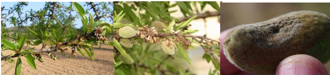
Εικόνα 1 Συμπτώματα μονιλίας σε βλαστούς και καρπό αμυγδαλιάς

Ο μύκητας διαχειμάζει στα έλκη, στους μουμιοποιημένους καρπούς και στους αποξηραμένους κλάδους. . Η είσοδος του παθογόνου στο δένδρο γίνεται από οποιοδήποτε μέρος του άνθους και από τους καρπούς