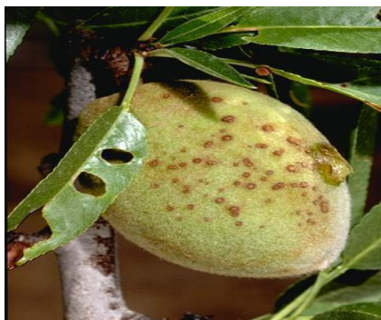
Εικόνα 2 Συμπτώματα κορύννεου σε φύλλα (τρύπες από σκάγια), βλαστό και καρπό