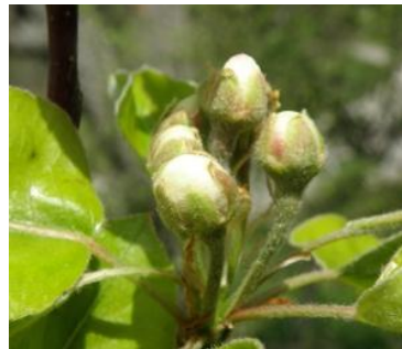
E - E2