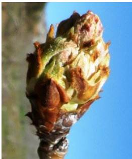
C3 - D