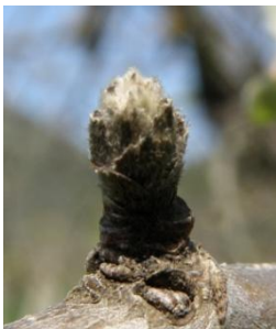
B - C