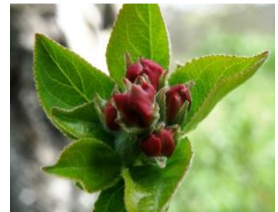
E - E2

Γενικά, στις ορεινές περιοχές , συνυπάρχουν την περίοδο αυτή τα παρακάτω βλαστικά στάδια :