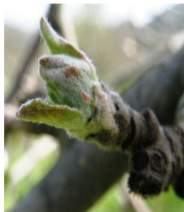
C3 - D