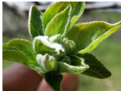
D3 - E