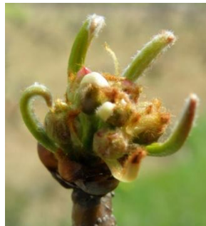
D - E