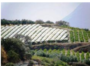
Σκεπαστά επιτραπέζια όψιμης συγκομιδής