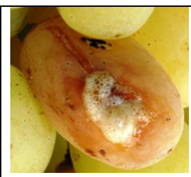
Όξινη σήψη και δροσόφιλα