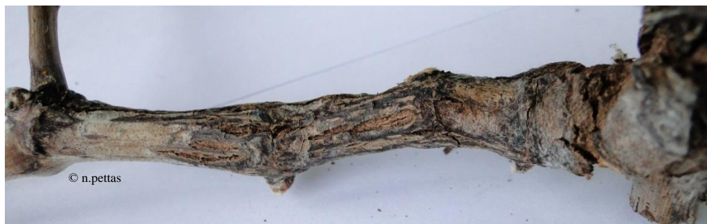
Φόμοψη ( Phomopsis viticola )