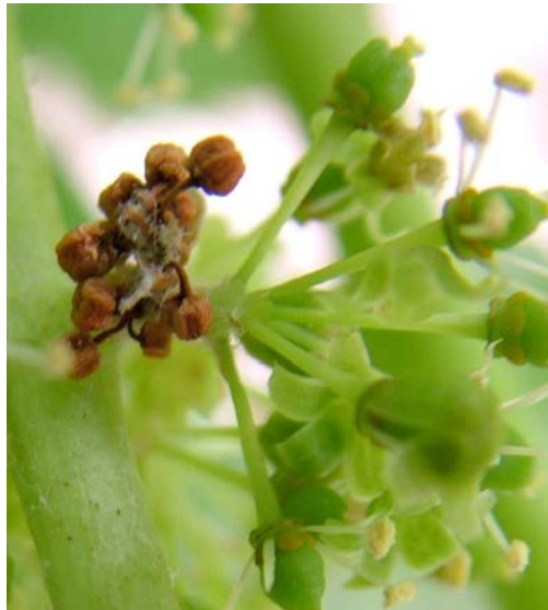
Εικόνα 1. Προσβολή ανθοταξίας από προνύμφες 1 ης γενιάς

Ο Προϊστάμενος του Π.Κ.Π.Φ.Π. & Φ.Ε. Θεσσαλονίκης