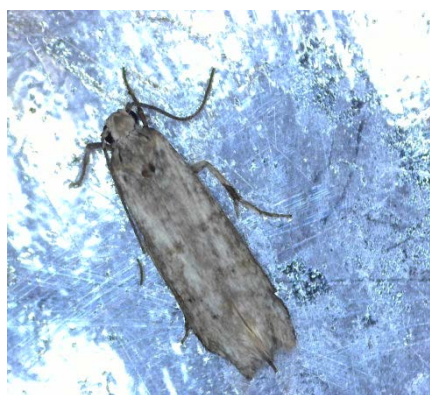
Πυρηνοτρήτης ( Prays oleae )