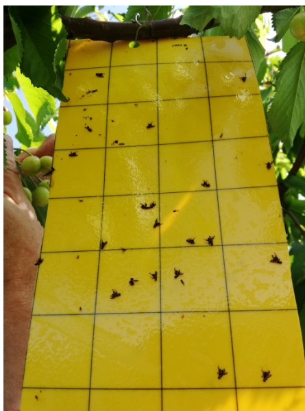
Εικόνα 1. Rhagoletis cerasi