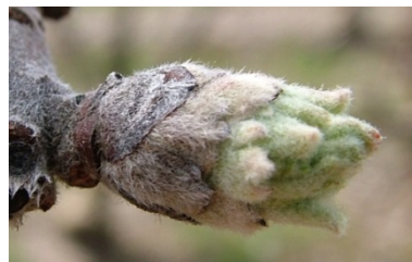
C 3 "αυτιά ποντικού"