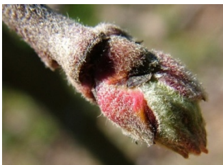
C πράσινη κορυφή