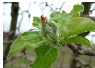
E ρόδινη κορυφή