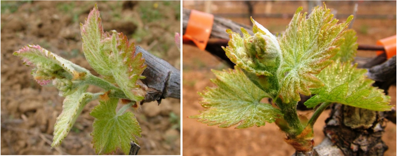
Στάδιο E (3 φύλλα, μήκος βλαστού τουλάχιστον 7 εκ.)