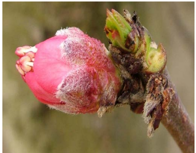
Ε Εμφάνιση στημόνων