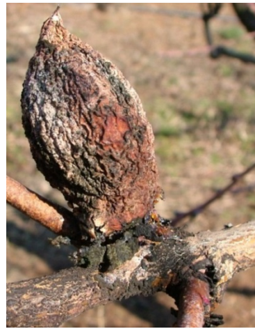
Προσβολή από Μονίλια