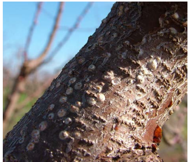
Παρουσία ασπιδίων βαμβακάδας στο 25%