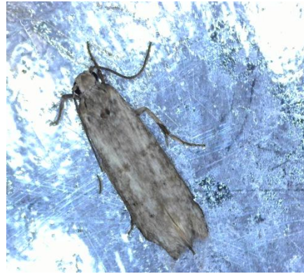
Πυρηνοτρήτης ( Prays oleae )