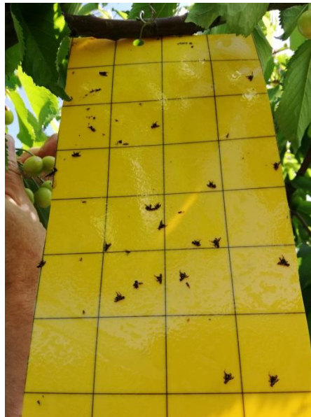
Εικόνα 1. Rhagoletis cerasi