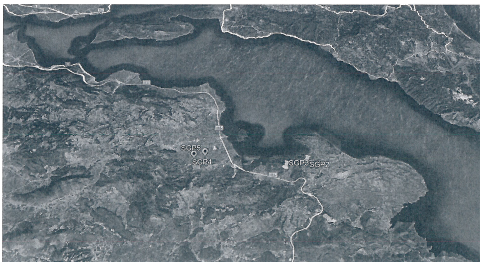
Εικόνα1. Εστίες Ευλογιάς Προβάτων στην Π.Ε. Φθιώτιδας.

Σας γνωρίζουμε ότι στις 21 Δεκεμβρίου 2023, το Εθνικό Εργαστήριο Αναφοράς για την Ευλογιά των προβάτων και αιγών επιβεβαίωσε την παρουσία του ιού σε δύο (2) εκτροφές προβάτων αποτελούμενες από 240 και 190 πρόβατα αντίστοιχα, στη Δημοτική Κοινότητα Αταλάντης, του Δήμου Λοκρών, της Περιφερειακής Ενότητας Φθιώτιδας, της Περιφέρειας Στερεάς Ελλάδας (Αναφορά ADIS. Αρ. 2023/4 και Αρ.2023/5 ) (Εικόνα 1). Όλα τα μέτρα που προβλέπονται στον Κανονισμό (Ε.Ε.) 2020/687 της Ευρωπαϊκής Επιτροπής καθώς και το υπ' αριθμ 1747/386028/14.12.23/Β'7121/18.12.2023 «Σχέδιο αντιμετώπισης έκτακτης ανάγκης για την καταπολέμηση των ασθενειών του Παραρτήματος Ι του Π.Δ. 138/1995 Α' 88.»εφαρμόζονται από τις αρμόδιες Κτηνιατρικές Αρχές της Π.Ε. Φθιώτιδας. Η επιδημιολογική έρευνα βρίσκεται σε εξέλιξη.