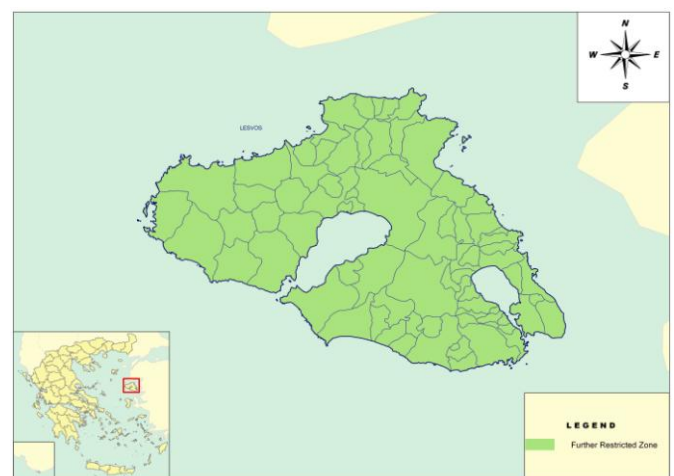
Εικόνα 2. Περαιτέρω Απαγορευμένη Ζώνη στην Π.Ε. Λέσβου