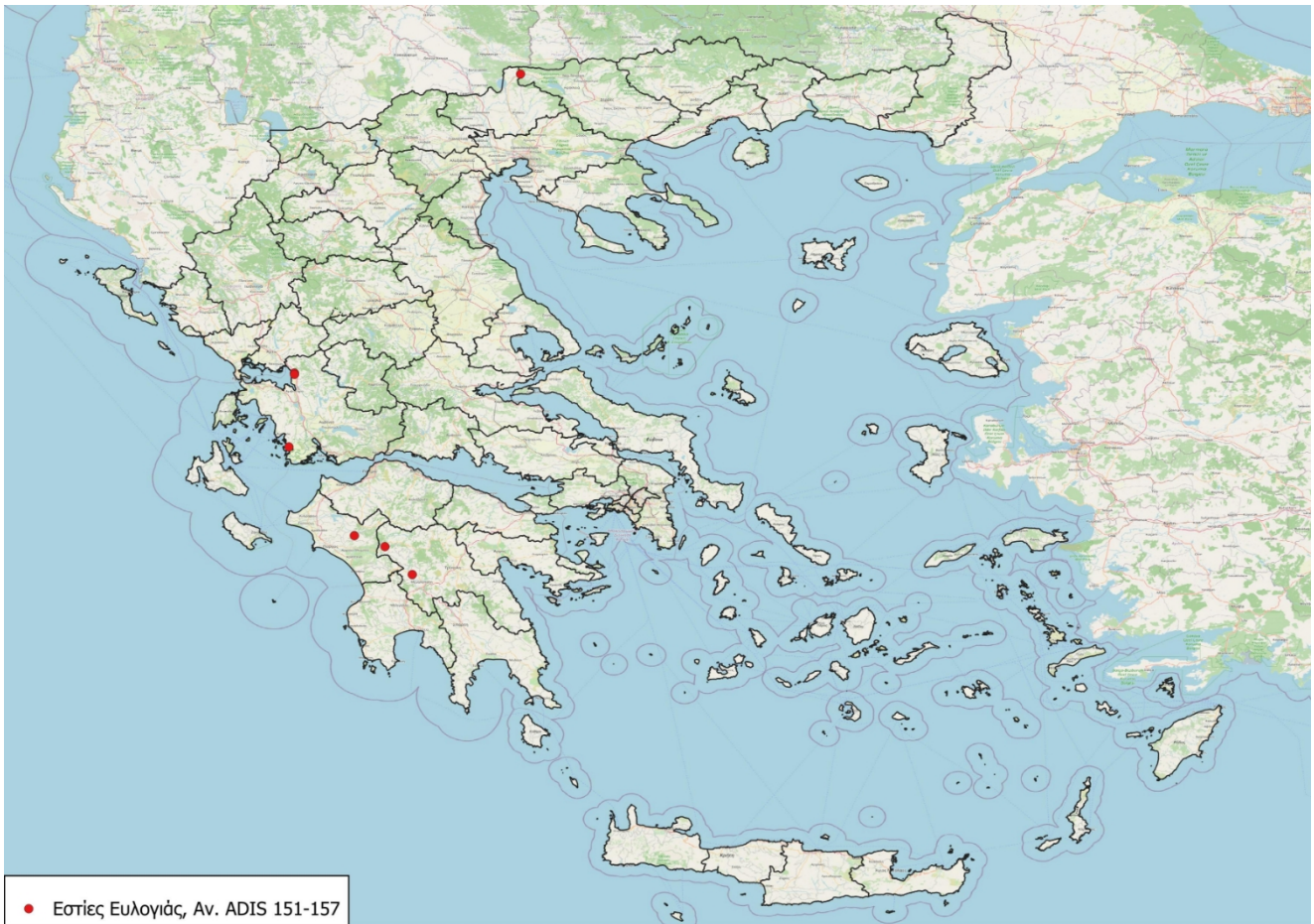
Εικόνα 1. Νέες Επιβεβαιωμένες Εστίες Ευλογιάς (27 Μαΐου - 5 Ιουνίου).

Κατόπιν διαβούλευσης με τις αρμόδιες υπηρεσίες της Ευρωπαϊκής Επιτροπής, ενσωματώθηκαν στο Παράρτημα της Εκτελεστικής Απόφασης (ΕΕ) 1366/2026 της 12 ης Ιουνίου 2026, σχετικά με την τροποποίηση της εκτελεστικής απόφασης (ΕΕ) 2024/2207 για ορισμένα μέτρα έκτακτης ανάγκης σχετικά με την ευλογία των αιγοπροβάτων. Στο πλαίσιο αυτό οριοθετήθηκαν οι παρακάτω ζώνες στις Π.Ε. Έβρου, Ροδόπης, Ξάνθης, Καβάλας, Θάσου, Δράμας, Σερρών, Κιλκίς, Χαλκιδικής, Πέλλας, Ημαθίας, Πιερίας, Κοζάνης, Λάρισας, Μαγνησίας, Καρδίτσας, Τρικάλων, Ευρυτανίας, Φθιώτιδας, Εύβοιας, Φωκίδας, Αιτωλοακαρνανίας, Αχαΐας, Ηλείας, Αρκαδίας, Μεσσηνίας, Λακωνίας, Αργολίδας, Κεφαλληνίας, Πρέβεζας, Άρτας, Θεσπρωτίας, Λευκάδας, Ιθάκης και στη Μ.Ε. Θεσσαλονίκης ως ακολούθως (Εικόνα 2):