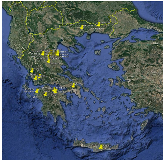
Εικόνα 1. Εστίες Πανώλης μικρών μηρυκαστικών (Αναφορές αρ. ADIS 1-54).

Κατόπιν επιβεβαίωσης πέντε (5) νέων εστιών πανώλης των μικρών μηρυκαστικών (PPR), στην Περιφερειακή Ενότητα Λάρισας της Περιφέρειας Θεσσαλίας (Αναφορές ADIS Αρ.2024/48,49,50,51,52) , μίας (1) εστίας στην Περιφερειακή Ενότητα Κορινθίας, της Περιφέρειας Πελοποννήσου (Αναφορά ADIS Αρ.2024/53), και μίας (1) εστίας στην Περιφερειακή Ενότητα Ηλείας της Περιφέρειας Δυτικής Ελλάδας (Αναφορά ADIS Αρ.2024/54), οριοθετούνται οι παρακάτω ζώνες στις Περιφερειακές Ενότητες (Π.Ε.) Τρικάλων, Λάρισας, Κορινθίας, Δυτικής Αττικής, Βοιωτίας, Αιτωλοακαρνανίας, Δράμας, Καβάλας, Σερρών, Ηλείας, Αρκαδίας, Ηρακλείου, Καρδίτσας, Γρεβενών, Δυτικού Τομέα Αθηνών, Πειραιά, Αργολίδας, Αχαΐας και Ροδόπης και ενσωματώνονται στην υπό έκδοση εκτελεστική απόφαση της Ευρωπαϊκής Επιτροπής όσον αφορά ορισμένα μέτρα έκτακτης ανάγκης σχετικά με τη λοίμωξη από τον ιό της πανώλης των μικρών μηρυκαστικών στην Ελλάδα (Εικόνες 1, 2):