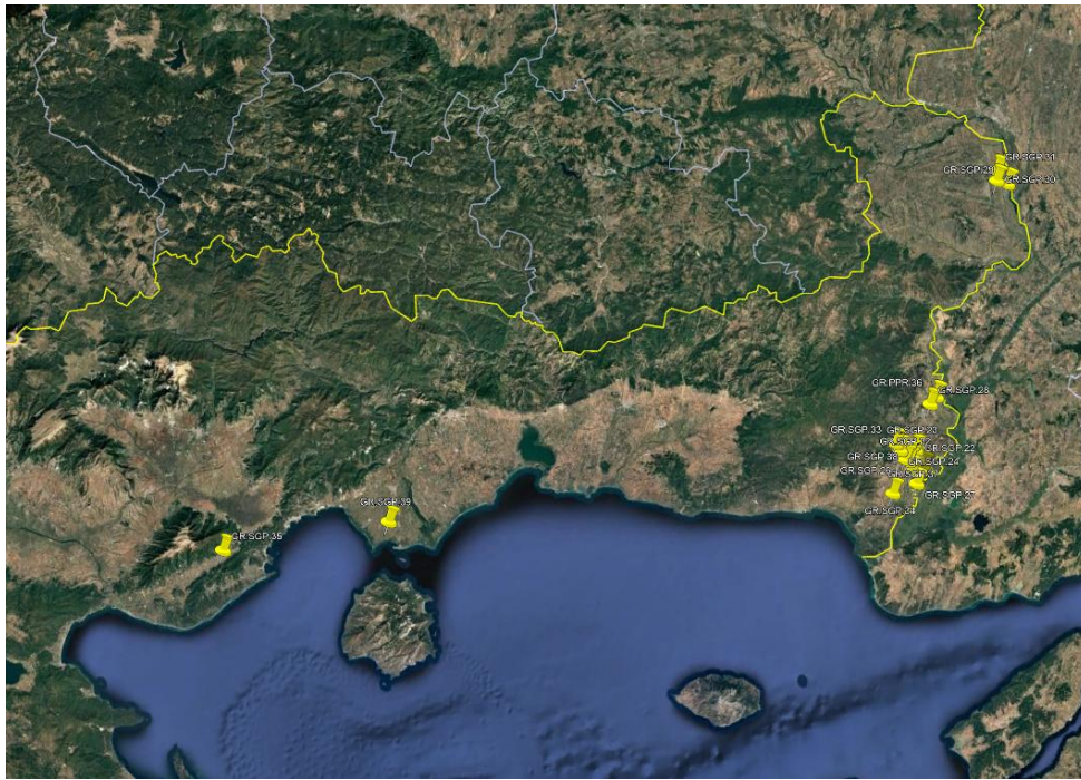
Εικόνα 1. Εστίες Ευλογίας στις Π.Ε. Έβρου και Καβάλας, (Αναφορές ADIS Αρ. 22-39)

Κατόπιν διαβούλευσης με τις αρμόδιες υπηρεσίες της Ευρωπαϊκής Επιτροπής, πρόκειται να ενσωματωθούν στο Παράρτημα της Εκτελεστικής Απόφασης, αναφορικά με ορισμένα μέτρα έκτακτης ανάγκης σχετικά με την ευλογία των αιγοπροβάτων και οριοθετούνται οι παρακάτω ζώνες στις Π.Ε. Έβρου, Καβάλας, Σερρών και Δράμας ως ακολούθως (Εικόνα 2):