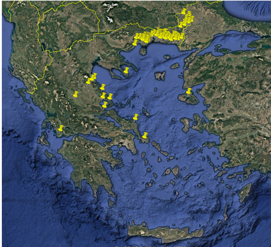
Εικόνα 1. Εστίες Ευλογίας (Αναφορές ADIS Αρ. 136-228).

Κατόπιν διαβούλευσης με τις αρμόδιες υπηρεσίες της Ευρωπαϊκής Επιτροπής, ενσωματώθηκαν στο Παράρτημα της Εκτελεστικής Απόφασης, αναφορικά με ορισμένα μέτρα έκτακτης ανάγκης σχετικά με την ευλογία των αιγοπροβάτων και οριοθετήθηκαν οι παρακάτω ζώνες στις Π.Ε. Έβρου, Ροδόπης, Ξάνθης, Καβάλας, Δράμας, Σερρών, Χαλκιδικής, Πιερίας, Λάρισας, Καρδίτσας, Μαγνησίας και Σποράδων, Τρικάλων, Φθιώτιδας, Φωκίδας, Αιτωλοακαρνανίας, Εύβοιας, Αργολίδας, Αρκαδίας, Κορίνθου, Λέσβου και στη Μητροπολιτική Ενότητα Θεσσαλονίκης, ως ακολούθως (Εικόνα 2):