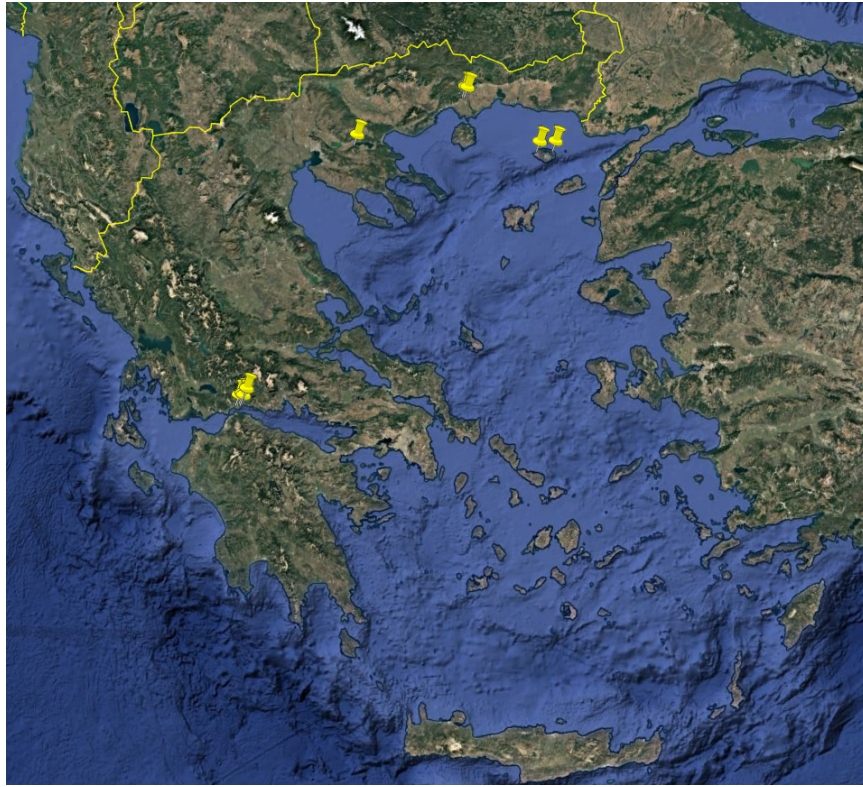
Εικόνα 1. Εστίες Ευλογιάς (Αναφορές ADIS Αρ. 2025/039 έως 2025/047).

Κατόπιν διαβούλευσης με τις αρμόδιες υπηρεσίες της Ευρωπαϊκής Επιτροπής, πρόκειται να ενσωματωθούν στο Παράρτημα της Εκτελεστικής Απόφασης (ΕΕ), αναφορικά με ορισμένα μέτρα έκτακτης ανάγκης σχετικά με την ευλογιά των αιγοπροβάτων και οριοθετούνται οι παρακάτω ζώνες στις Π.Ε. Έβρου, Ροδόπης, Ξάνθης, Καβάλας, Δράμας, Χαλκιδικής, Μαγνησίας και Σποράδων, Φθιώτιδας, Φωκίδας, Αιτωλοακαρνανίας, Ηρακλείου, στη Μητροπολιτική Ενότητα Θεσσαλονίκης, στον Δήμο Σαμοθράκης και στον Δήμο Σκύρου ως ακολούθως (Εικόνα 2):