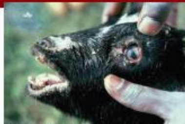
Ορώδες υγρό από τα μάτια και τη μύτη, έντονη σιελόρροια (εικόνα βρεγμένου προσώπου)