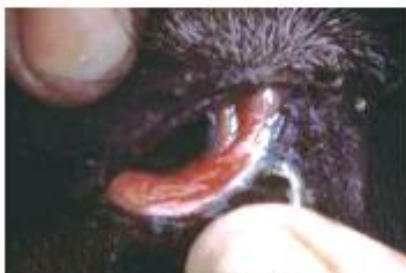
Κόκκινα, Πρησμένα μάτια