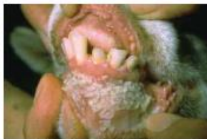
Αλλοιώσεις στο στόμα: λευκές πλάκες στα ούλα και στο εσωτερικό των χειλιών