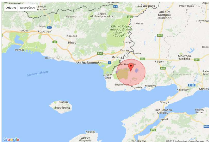
Εικόνα 1: Εστία και Ζώνη 13 χλμ

Σας ενημερώνουμε ότι την 1η Ιουνίου 2017, κοινοποιήθηκε, μέσω του συστήματος ADNS, εστία Ευλογιάς στην Ευρωπαϊκή Τουρκία, στην Κοyunτιpe της περιοχής Edirne, γεωγρ. πλάτος: 40.76 και γεωγρ. μήκος: 26.33 (βλ. εικόνα 1) και με ημερομηνία επιβεβαίωσης την 17η Απριλίου 2017.