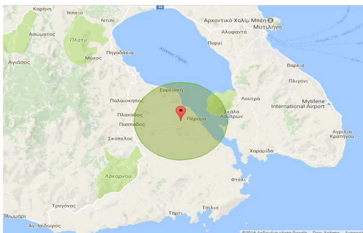
Εικόνα 2: Εστία και Ζώνη 3 χλμ

Παρακαλούμε για την άμεση ενημέρωση όλων των εμπλεκόμενων φορέων, έτσι ώστε να ληφθούν άμεσα όλα τα απαραίτητα μέτρα για τον περιορισμό της εξάπλωσης του νοσήματος.