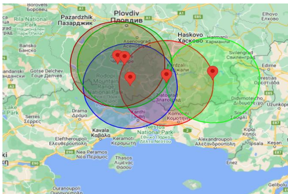
Εικόνα 1. Εστίες ΑΠΧ στη Βουλγαρία και ζώνη ακτίνας 50χλμ

Σας ενημερώνουμε ότι στις 9 Φεβρουαρίου 2024 μέσω του συστήματος ADIS της Ευρωπαϊκής Επιτροπής κοινοποιήθηκαν, μεταξύ άλλων, εννέα (9) δευτερογενείς εστίες Αφρικανικής Πανώλης των Χοίρων (ΑΠΧ) σε αγριόχοιρους στη Βουλγαρία στην περιοχή Kardzhali (1), Haskovo (1) και Smolyan (7) σε κοντινή απόσταση από τα ελληνοβουλγαρικά σύνορα (Εικ. 1, 2).