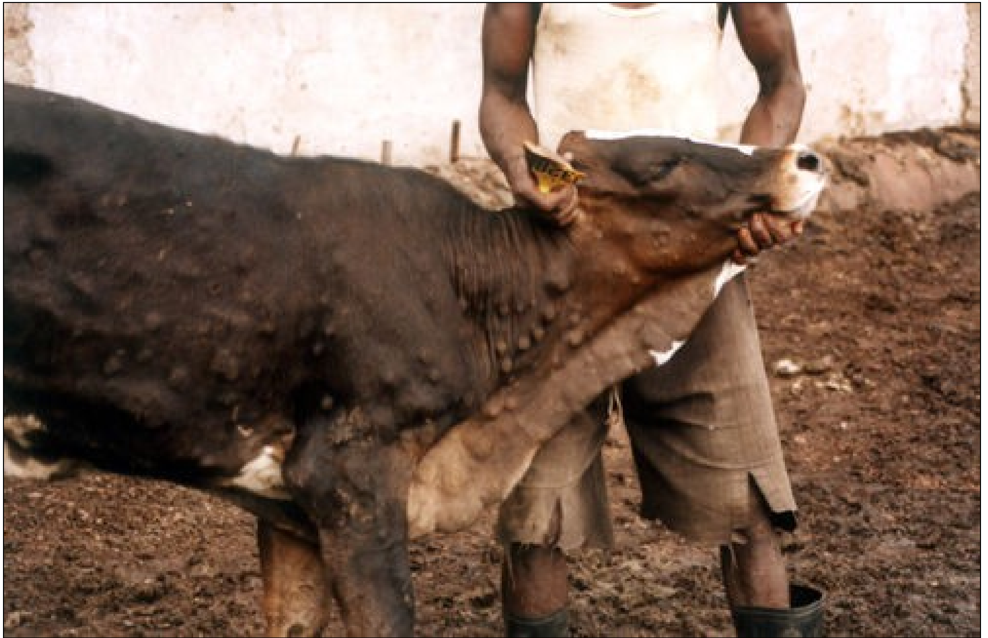
Φώτο 4