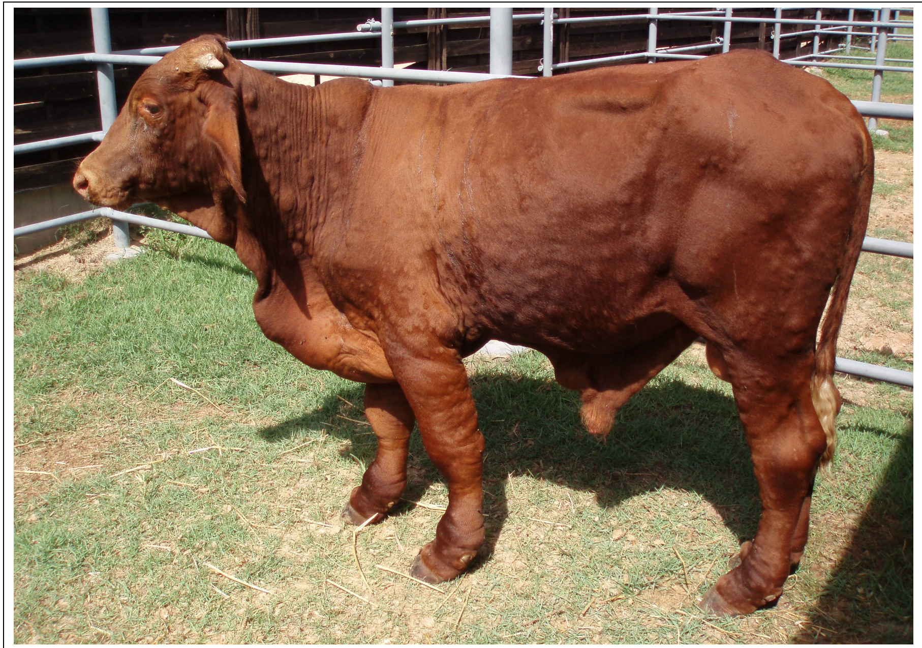
Φώτο 3