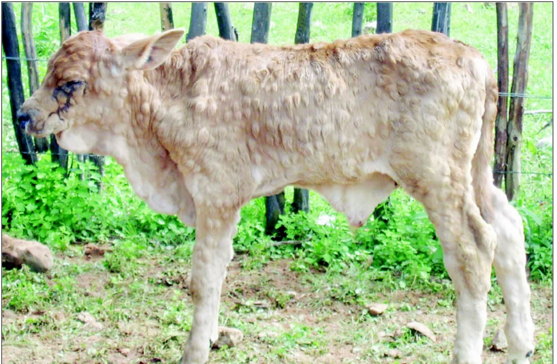
Φώτο 4