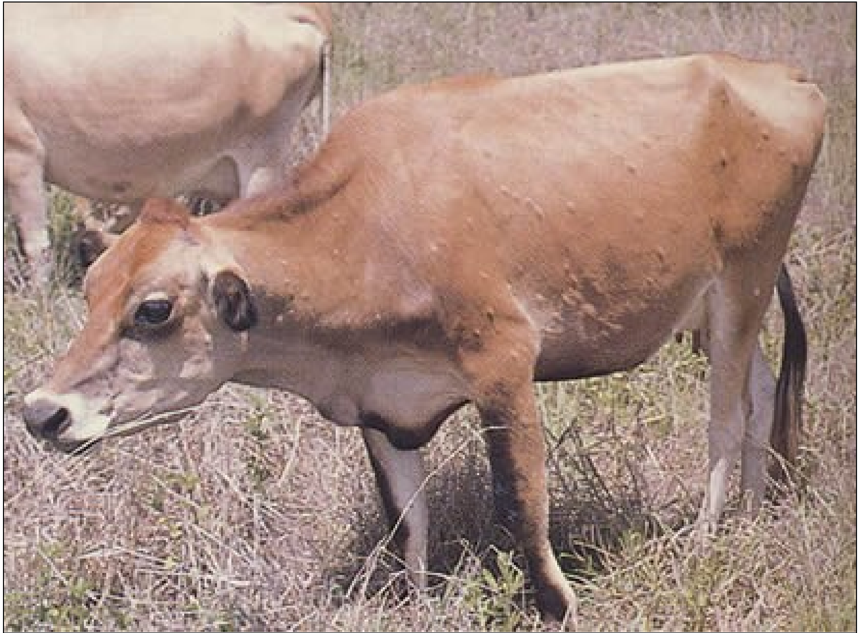
Φώτο 2