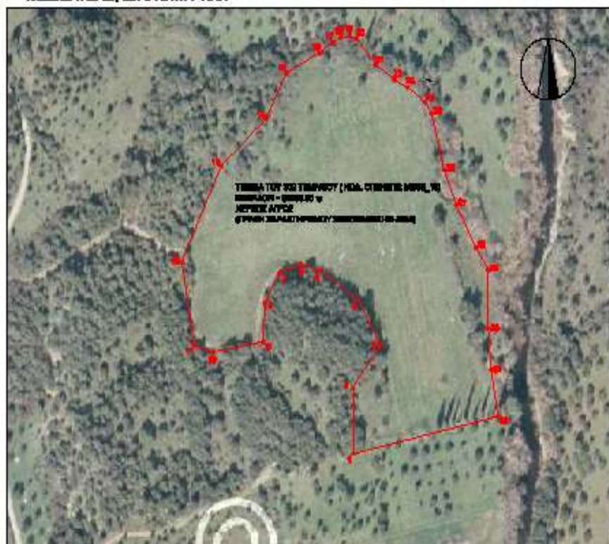
ΠΙΝΑΚΑΣ ΣΥΝΤΕΤΑΓΜΕΝΩΝ ΚΟΡΥΦΩΝ ΣΕ ΕΓΣΑ 87 ΤΜΗΜΑΤΟΣ 302 ( ΚΩΔ. ΟΠΕΚΕΠΕ: ΜΕΣΣ_13)