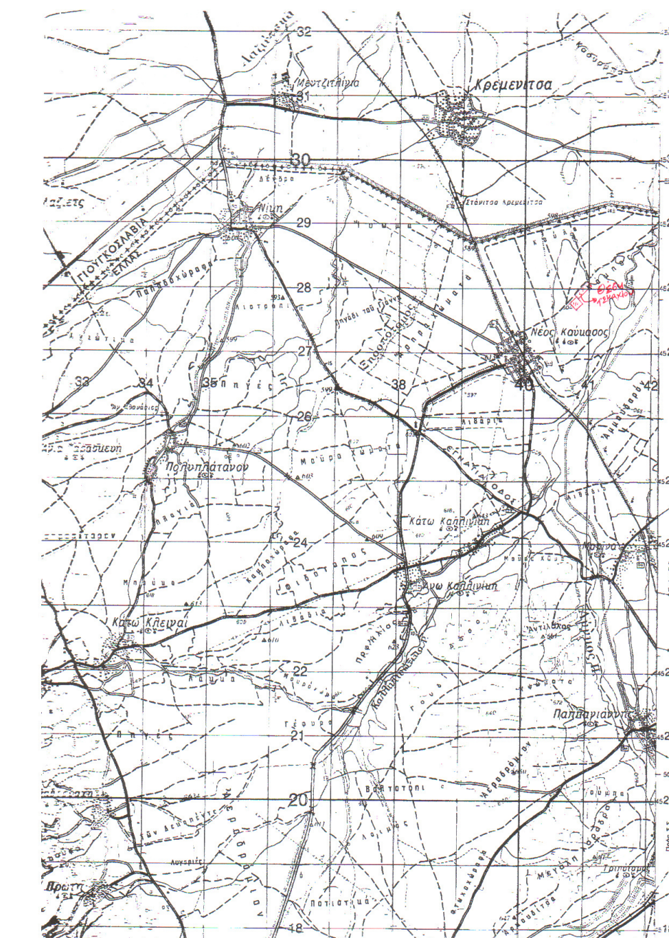
ΑΠΟΣΠΑΣΜΑ ΑΠΟ ΧΑΡΤΗ Γ.Υ.Σ. 1:50.000