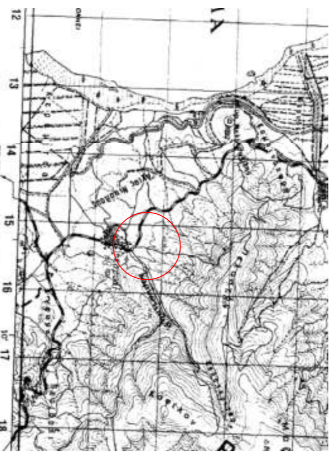
ΑΠΟΣΠΑΣΜΑ ΧΑΡΤΗΣ ΓΥΣ Ι : 50.000 ΘΥΛΑΟ ΑΝΤΑΡΚΤΙΚΟΥ

ΟΡΟΙ ΔΟΜΗΣΗΣ Π.Δ.24-4-85 (Φ.Ε.Κ. 576Δ/03-07-86) Όπως τροποποιήθηκε και ισχύει. ΑΡΤΙΟΤΗΤΑ : Εμβαδόν 300 τ.μ. ΚΑΛΥΨΗ : 60% της επιφ. του γηπέδου ή κατά αναγκάσει Σ.Δ. : 240 τ.μ. (για επιφ.<700 τ.μ.) και 400 τ.μ. (για επιφ.>700τ.μ.) ΜΕΤΡΙΟ ΥΨΟΣ : : 7,50μ. ή κατά αναγκάσει ΑΡΙΘΜΟΣ ΟΡΟΦΩΝ : : 2 ή κατά αναγκάσει ΠΡΟΣΔΙΟ : : 10μ. (για επιφ.<500 τ.μ. και 15μ (για επιφ.>500 τ.μ.) ΑΠΟΣΤΑΣΕΙΣ ΑΠΟ ΟΡΙΑ : : 2,50 μ.