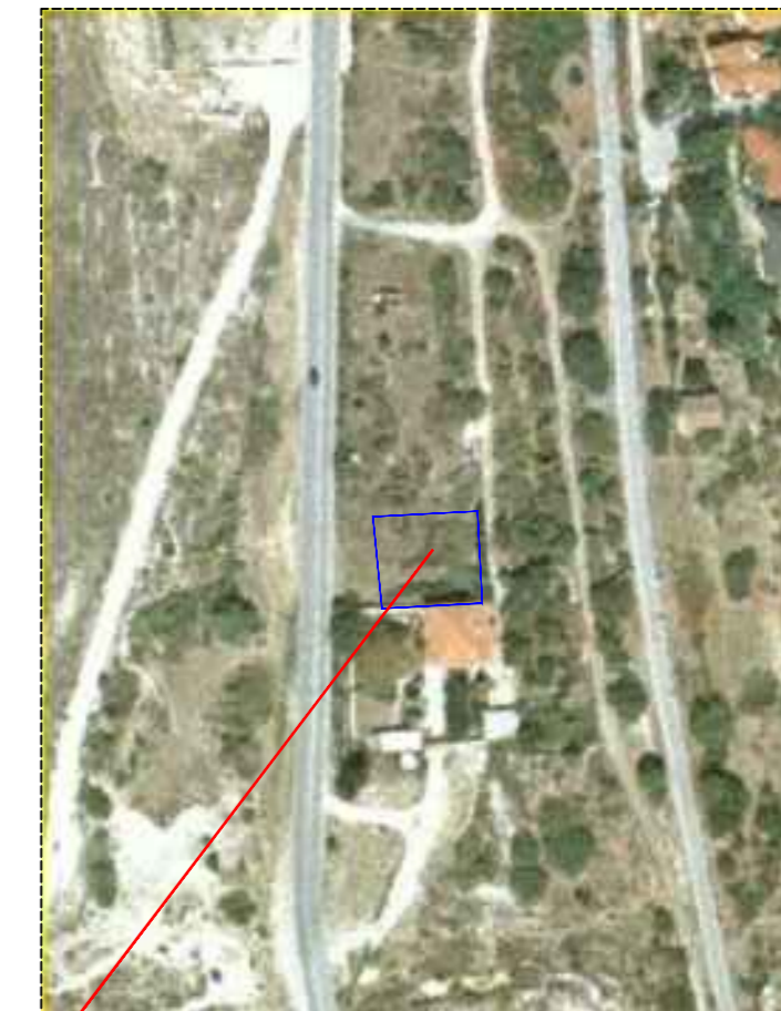
● ΘΕΣΗ ΟΙΚΟΠΕΔΟΥ ΠΡΟΣ ΜΙΣΘΩΣΗ

Δήλωση Μηχανικού Δηλώνω υπεύθυνα ότι το παρόν οικοπέδο με (Α,Β,Γ,Δ -Α) που βρίσκεται εντός του αρχικού οικισμού Άρνισσας Δ Έδεσσας Ν Πέλλας, αποτελεί διανομή και έχει εμβαδόν: E(A,B,\Gamma,\Delta -A) = 539.17\tau.μ. Το παραπάνω οικοπέδο είναι ΑΡΤΙΟ και ΟΙΚΟΔΟΜΙΣΤΗΜΟ σύμφωνα με τις ισχύουσες Πολεοδομικές Διατάξεις. Δεν αντικείται στον Ν 651/77 κ δεν υπαχεται στις διατάξεις του Ν 1337/83 Τα όμορα προς αυτό οικοπέδα είναι επίσης ΑΡΤΙΑ και ΟΙΚΟΔΟΜΙΣΤΗΜΑ σύμφωνα με τις ισχύουσες Πολεοδομικές Διατάξεις. Η ΜΗΧΑΝΙΚΟΣ