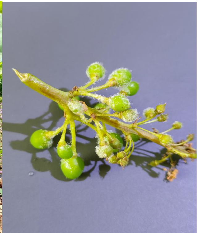
Προσβολή περονοσπόρου σε βότρυες και κονιδιοφόροι του μύκητα.