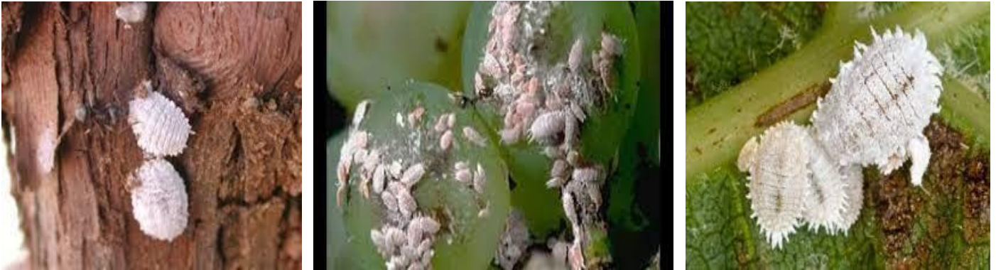
Θηλυκά άτομα και προνυμφικά στάδια ψευδόκοκκου σε πρέμνο, ρόγες και φύλλο