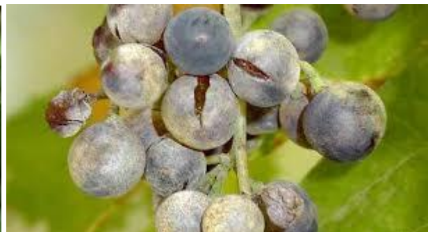
Προσβολή ωιδίου σε σταφύλι.