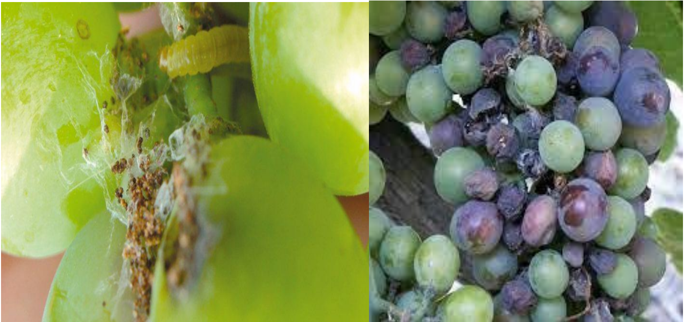
Προσβολή και προνύμφη ευδεμίδας σε ρόγες σταφυλιού

Το σωστό ξεφύλλισμα βοηθά στην πλήρη και αποτελεσματική διαβροχή των σταφυλιών με το ψεκαστικό υγρό.