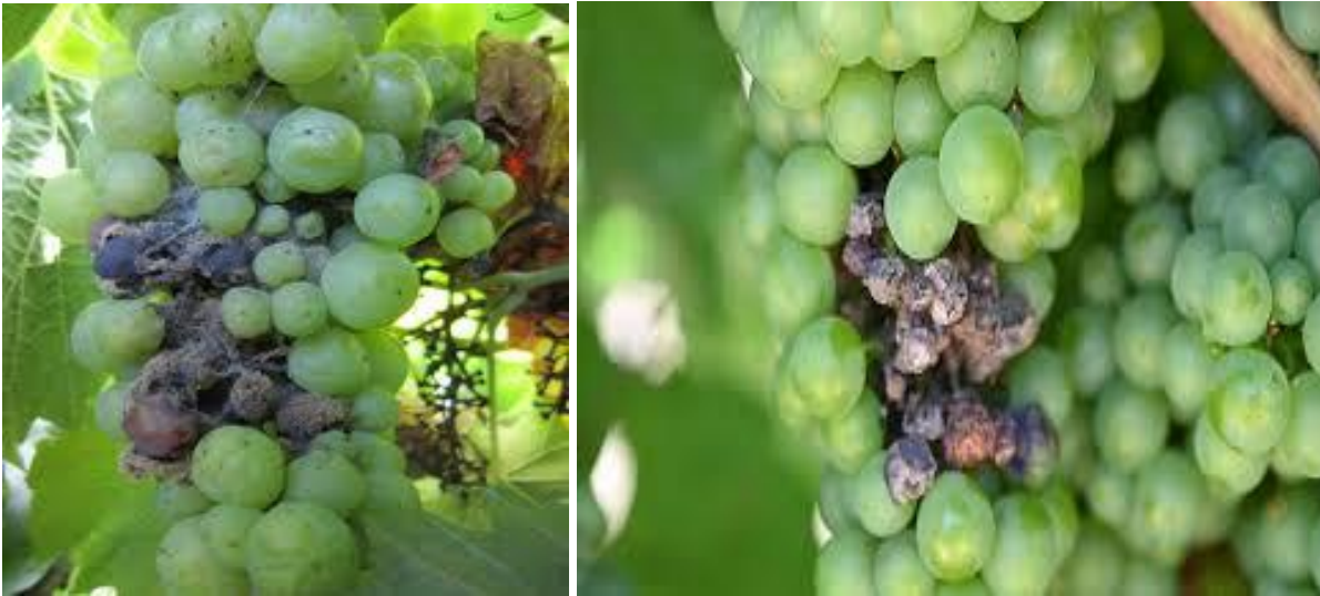
Προσβολή βοτρυτή σε σταφύλια και γκρίζου χρώματος καρποφορίες του μύκητα

Τέτοια μέτρα είναι τα κατάλληλα θερινά κλαδέματα, η καταστροφή των ζιζανίων, η αποστράγγιση του εδάφους και ο περιορισμός της αζωτούχου λίπανσης, που οδηγεί σε υπερβολική και ευπρόσβλητη βλάστηση.