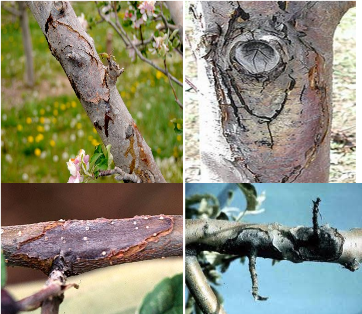
Εικ. Χαρακτηριστικές προσβολές (έλκη) του βακτηρίου στον κορμό και σε κλάδους