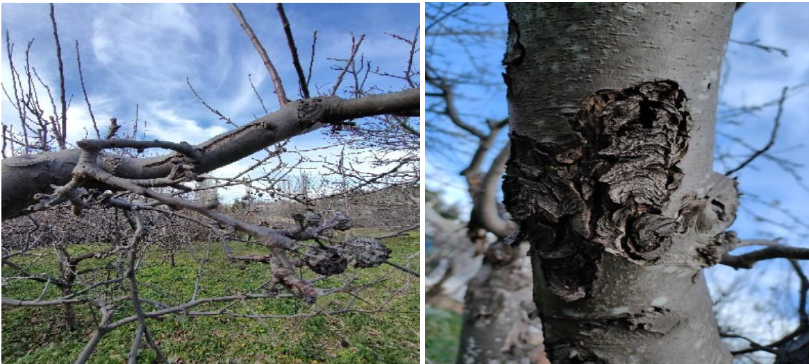
Εικ. Χαρακτηριστικές μυκητολογικές προσβολές (έλκη) σε κλάδους και μουμιοποιημένοι καρποί μηλιάς.

Ειδικότερα, για τα φουζικλάδια των μηλοειδών και τη σεπτορίαση της αχλαδιάς , συνιστάται παράχωμα των πεσμένων φύλλων ή ψεκασμός τους με ουρία, η οποία επιταχύνει την αποσύνθεσή τους. Οι πρακτικές αυτές είναι μεγάλης σημασίας, διότι συμβάλλουν σημαντικά στη μείωση των αρχικών μολυσμάτων των ασθενειών. Ωστόσο, αποδίδουν τα μέγιστα, μόνο όταν εφαρμόζονται από όλους τους παραγωγούς μιας περιοχής. Στην περίπτωση που οι παραπάνω πρακτικές έχουν ήδη εφαρμοστεί κατά την περίοδο του φθινοπώρου, δεν χρειάζεται να επαναληφθούν.