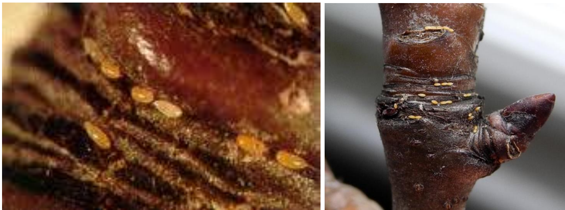
Εικ. Ωά ψύλλας ανάμεσα σε ρυτιδώματα της βάσης ανθοφόρων οφθαλμών της αγλαδιάς.

Λίγο αργότερα και κατά τη βλαστική περίοδο, οι λαίμαργοι βλαστοί πρέπει να απομακρύνονται με το χέρι όταν είναι ακόμη τρυφεροί, διότι συγκεντρώνουν μεγάλο πληθυσμό του εντόμου.