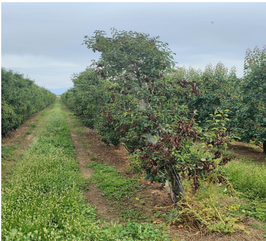
Προσβολή βακτηρίου σε αχλαδιά

Παράλληλα, συνιστάται ο περιορισμός της αζωτούχου λίπανσης καθώς και της άρδευσης στην απολύτως αναγκαία, διότι η ασθένεια αποβαίνει ιδιαίτερα σοβαρή στα εύρωστα δένδρα.