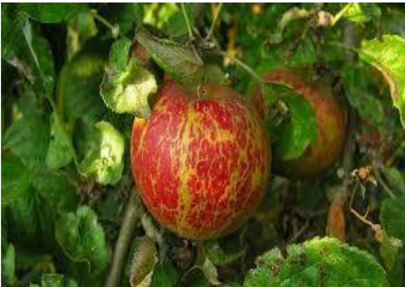
Προσβολή μήλου από οΐδιο.

Σε ευαίσθητες, κυρίως, ποικιλίες και όπου έχουν εκδηλωθεί συμπτώματα σε καρπούς, συνιστάται άμεσα επέμβαση, σε συνδυασμό με την καταπολέμηση του φουζικλαδίου.