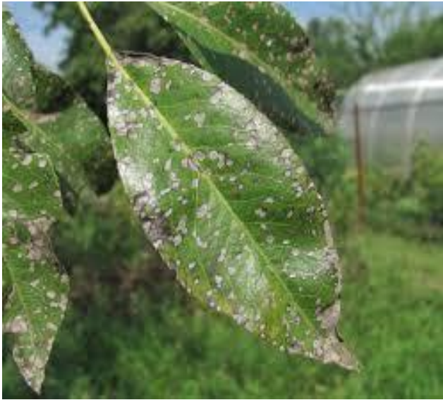
Ισχυρή προσβολή σепτόριας σε φύλλο αχλαδιάς