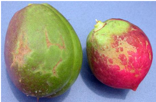
Προσβολή θρίπα σε νεκταρίνια.