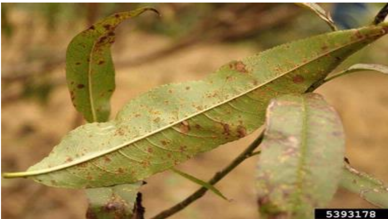
Σύμπτωμα σκωρίασης σε φύλλα ροδακινιάς.

Ο ψεκάσμος αυτός θα μπορούσε να συνδυαστεί με εκείνο για τη Φαιά Σήψη (Μονίλια)