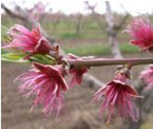
Ροδακινιά / Νεκταρινιά