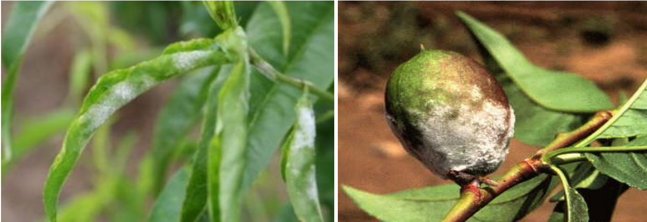
Σύμπτωμα ωιδίου σε νεκταρινιά

Οι ψεκάσμοι αυτοί θα μπορούσαν να συνδυαστούν με εκείνο για τη Φαιά Σήψη (Μονίλια).