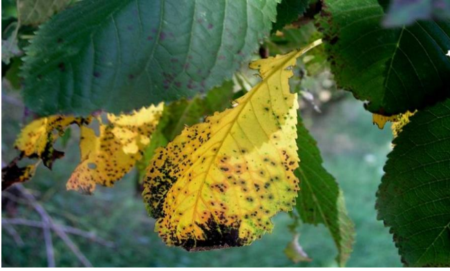
Σύμπτωμα κυλινδροσπορίωσης σε φύλλα κερασιάς