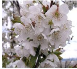
Κερασιά / Βυσσινιά