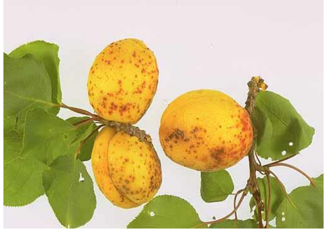
Σύμπτωμα κορύνεου σε ροδάκινα και βερίκοκα