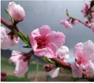
Ροδακινιά / Νεκταρινιά