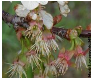
Κερασιά / Βυσσινιά