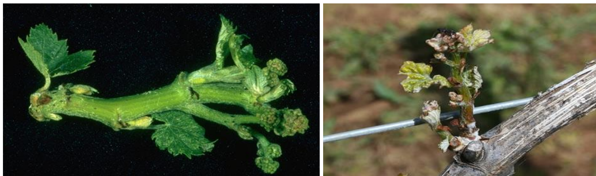
Έντονη παραμόρφωση νεαρών βλαστών από τη δράση σκωληκόμορφων ακάρεων Eriophyidae.

Καταπολέμηση συνιστάται, μόνο στην περίπτωση που έχουν διαπιστωθεί σημαντικές ζημιές (κυρίως νεκρώσεις οφθαλμών και ισχυρές παραμορφώσεις βλαστών και φυλλώματος) την προηγούμενη καλλιεργητική περίοδο. Η καταπολέμηση αφορά ψεκάσμο με βρέξιμο θείο 1% στο φούσκωμα των οφθαλμών (στάδια B1–B3 ). Μετά την έκπτυξη των οφθαλμών και για λόγους τοξικότητας, η αναλογία πρέπει να μειωθεί σε 0,8-0,6%. Ο ψεκάσμος αυτός είναι μεγάλης σημασίας, διότι οι επεμβάσεις μετά την εκδήλωση των συμπτωμάτων με βρέξιμο θείο, δεν έχουν ικανοποιητικά αποτελέσματα.