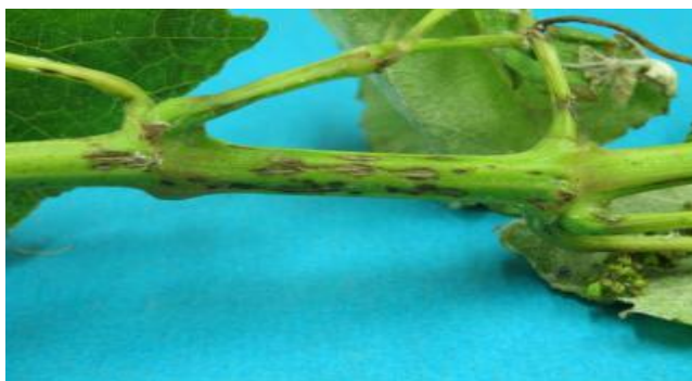
Χαρακτηριστικό σύμπτωμα των ασθενειών σε τρυφερή κληματίδα.

Η βροχή και οι σχετικά χαμηλές θερμοκρασίες συμβάλουν θετικά στην απελευθέρωση των πυκνιδιοσπορίων και στη μολυσματικότητα της ασθένειας.