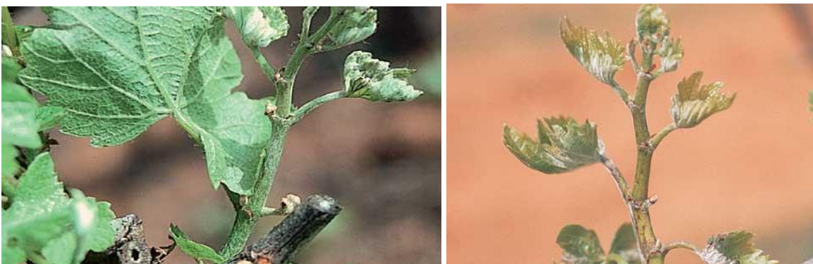
Νεαροί βλαστοί με έντονη προσβολή από ωίδιο (Uncinula necator)

Για τον περιορισμό του αρχικού μολύσματος συστήνεται η αναζήτηση των προσβεβλημένων αρχικών βλαστών (flag shoots), οι οποίοι συλλέγονται και καταστρέφονται. Καλό είναι να σημειώνεται με κορδέλα το προσβεβλημένο πρέμνο για να τύχει επιμελέστερης εξέτασης στις επόμενες παρατηρήσεις. Αυτό το καλλιεργητικό μέτρο καλό είναι να εφαρμόζεται από τους αμπελουργούς μία φορά την εβδομάδα, αρχίζοντας δύο εβδομάδες μετά την έκπτυξη των οφθαλμών και μέχρι την άνθηση.