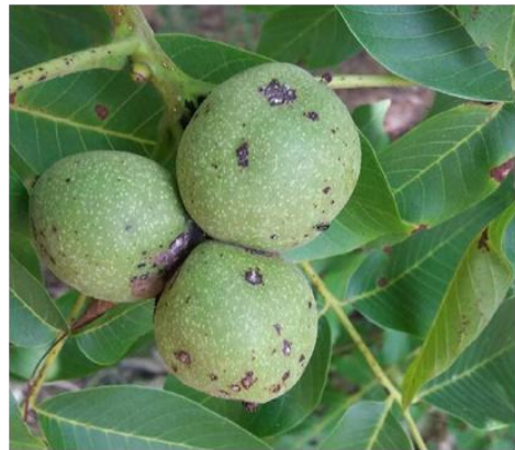
Εικ. 11. Προσβολή καρπού