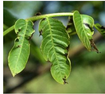
Εικ. 8 & 9. Προσβολή φύλλων