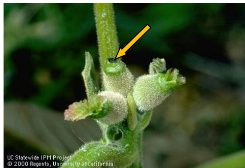
Εικ. 3. Προσβολή θηλυκού άνθους