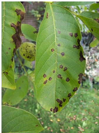
Εικ. 10. Προσβολή φύλλου