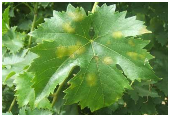
Προχωρημένη προσβολή φύλλων, όπως αυτή φαίνεται στην πάνω επιφάνεια.