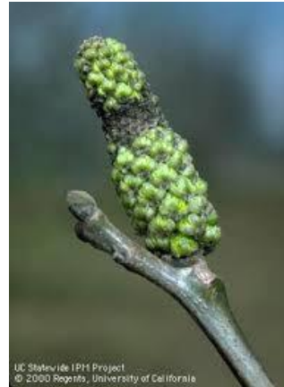
Εικ. 1 & 2. Προσβολή ιούλων