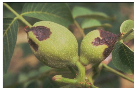
Εικ. 4 & 5. Προσβολή καρπών