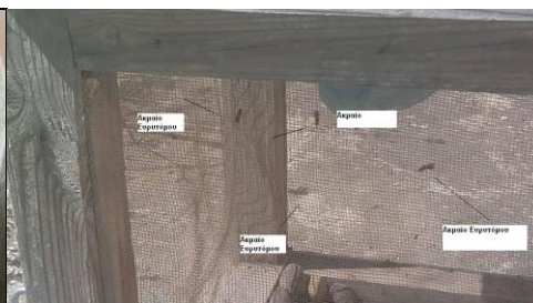
Έξοδος του Ευρυτόμου σε κλωβό του ΠΚΠΦ Βόλου 2017

Το ευρύτομο είναι ο σημαντικότερος εχθρός της αμυγδαλιάς, έχει μία γενεά το έτος και προκαλεί μεγάλη απώλεια της παραγωγής. Μοιάζει με μαύρο φτερωτό μυρμήγκι, διαχειμάζει ως ανεπτυγμένη προνύμφη μέσα στα προσβεβλημένα αμύγδαλα, που συνήθως παραμένουν μумιοποιημένα στο δένδρο.