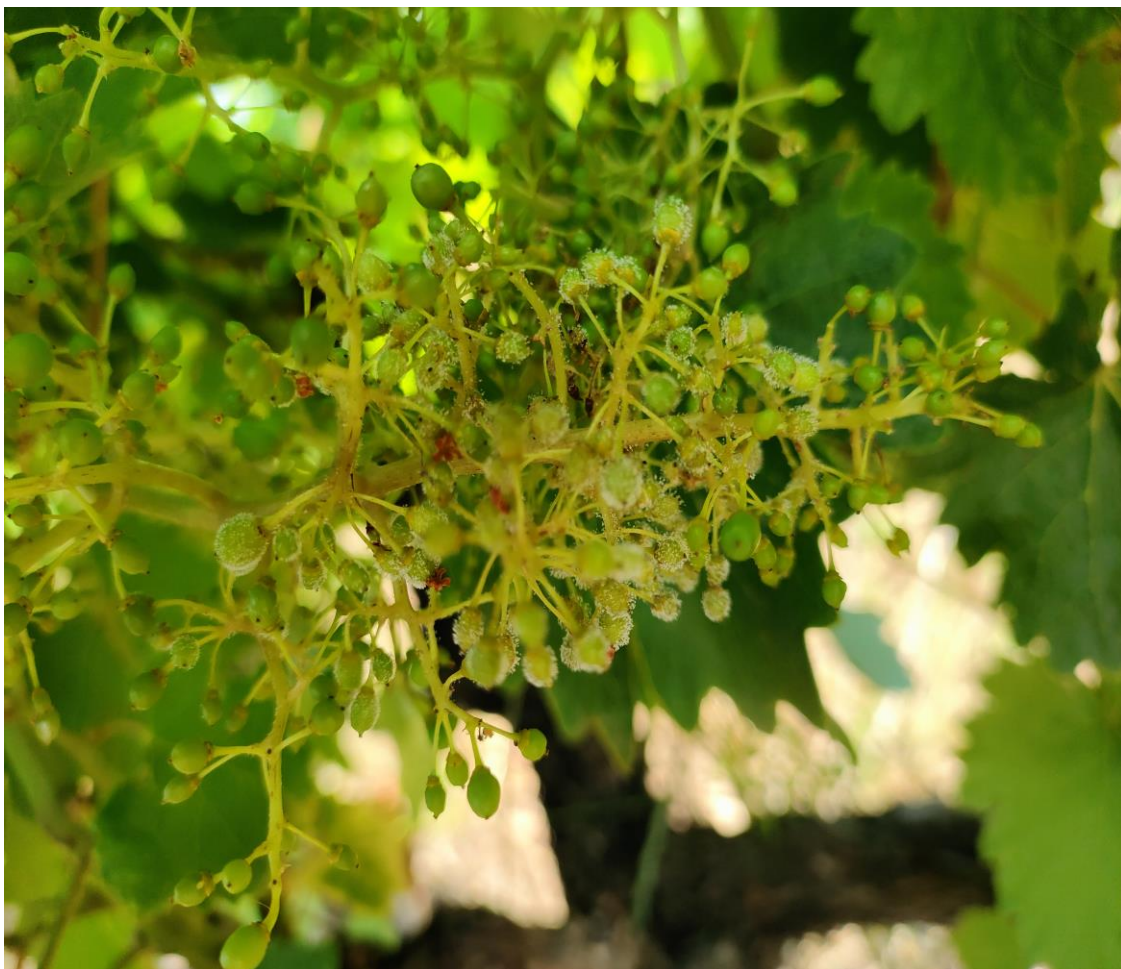
Προσβολή βότρυος από περονόσπορο. Φωτ. Θ. Μόσχος.