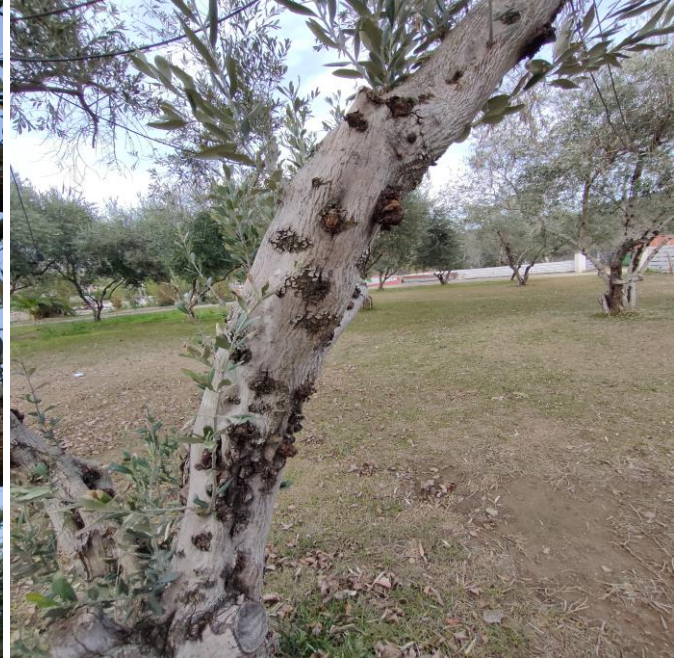
Βακτηριακοί όγκοι (υπερπλασίες σε χονδρούς βραχίονες και τον κορμό ελαιοδένδρων.