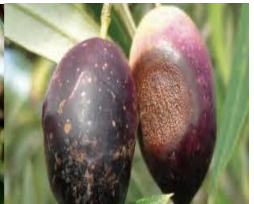
Καρποί σε διαφορετικά στάδια ωρίμανσης προσβεβλημένοι από τον μύκητα