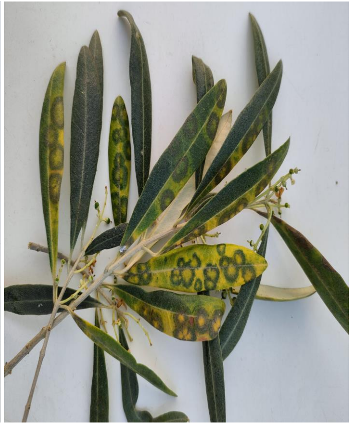
Προσβολή του μύκητα σε φύλλα.

Η ποικιλία Κονσερβολιά, που καλλιεργείται κυρίως στην περιοχή μας, θεωρείται ιδιαίτερα ευαίσθητη στην ασθένεια.