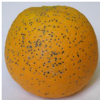
Παρλατόρια ή Μαύρη ψώρα