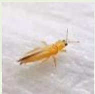
Εικ.3 Θρίπας

Προσβάλλει όλα τα πράσινα μέρη του φυτού από τα πρώτα στάδια ανάπτυξης και τους βότρες. Διαχειμάζει σε σχισμές του πρέμνου. Ο θρίπας προκαλεί ζημιές στους εκπτυσσόμενους οφθαλμούς και σε νεαρά φύλλα. Σε μεταγενέστερη προσβολή δημιουργεί καφέ χρώματος εσχάρωσεις, και εξογκώματα-σκληρύνσεις στην επιδερμίδα του καρπού. Προκαλεί μείωση της εμπορικής αξίας των επιτραπέζιων σταφυλιών. Περισσότερο ευπαθής θεωρείται η ποικιλία Βικτώρια. Απαιτείται έλεγχος