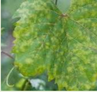
Εικ. 2 Προσβολή φυλλώματος αμπελιού από ωίδιο.

Θεωρείται από τις πιο σοβαρές ασθένειες στο αμπέλι και η μη έγκαιρη αντιμετώπιση της έχει ως αποτέλεσμα τη μείωση της παραγωγής σε ποσότητα και ποιότητα. Ο μύκητας διαχειμάζει σε ξυλώδεις βλαστούς και σε φυτικά υπολείμματα που παραμένουν στο έδαφος για μεγάλο χρονικό διάστημα. Η ασθένεια εμφανίζεται κατά την έκπτυξη της νέας βλάστησης. Ευνοείται από σχετικά υψηλές θερμοκρασίες και αυξημένη ατμοσφαιρική υγρασία. Προσβάλλει φύλλα, βλαστούς και βότρες. Χαρακτηριστικό σύμπτωμα της ασθένειας είναι το λευκό επίχρισμα στα προσβεβλημένα μέρη.