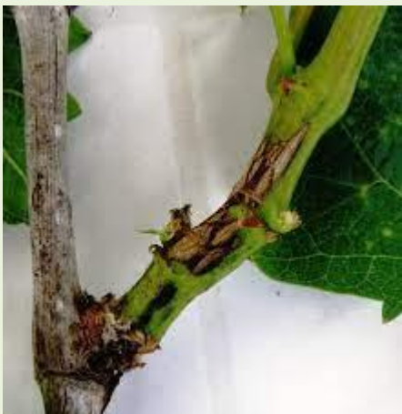
Εικ. 1 Φόμοψη σε ετήσιο βλαστό.