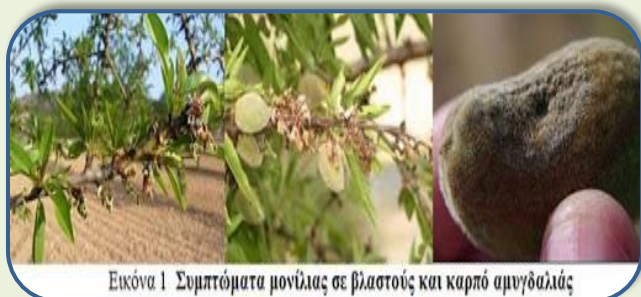
Εικόνα 1 Συμπτώματα μονίλιας σε βλαστούς και καρπό αμυγδαλιάς

Ο μύκητας προκαλεί ζημιές στα άνθη και τους βλαστούς. Τα άνθη φαίνονται σαν καμένα και οι βλαστοί φέρουν έλκη. Με βροχερό καιρό εμφανίζονται τεφρόχρονες εξανθήσεις στα προσβεβλημένα φυτικά μέρη και έκκριση κόμματος στους προσβεβλημένους βλαστούς. Η ασθένεια αντιμετωπίζεται κυρίως με