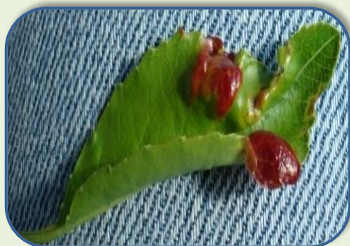
Εικόνα 4: Π.Κ.Π.Φ&Π.Ε. Καβάλας

Η ασθένεια προσβάλλει κυρίως τα φύλλα προκαλώντας πάχυνση του ελάσματος και διόγκωση του κεντρικού νεύρου με ταυτόχρονη παραμόρφωση και συστροφή προς τα μέσα. Τα φύλλα αποκτούν κόκκινο - ιώδες χρώμα και είναι εμφανή από απόσταση. Συνιστάται καταπολέμηση στο στάδιο της διόγκωσης των οφθαλμών και επανάληψη στην πτώση των πετάλων με κατάλληλα-εγκεκριμένα φυτοπροστατευτικά σκευάσματα. Η εξέλιξη της ασθένειας παύει με την άνοδο των θερμοκρασιών.