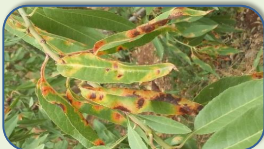
Εικόνα 6: pharmacon.gr

Η εμφάνιση κίτρινων – καστανέρυθρων κηλίδων στα φύλλα, η οποία εκδηλώνεται σε επόμενο στάδιο αποτελεί χαρακτηριστικό σύμπτωμα της ασθένειας. Οι μολύνσεις των φύλλων διαρκούν μέχρι τα μέσα καλοκαιριού και σε έντονες προσβολές μπορεί να προκαλέσουν αποφύλλωση των δέντρων. Συνιστάται καταπολέμηση μετά την έκπτυξη των φύλλων με εγκεκριμένα