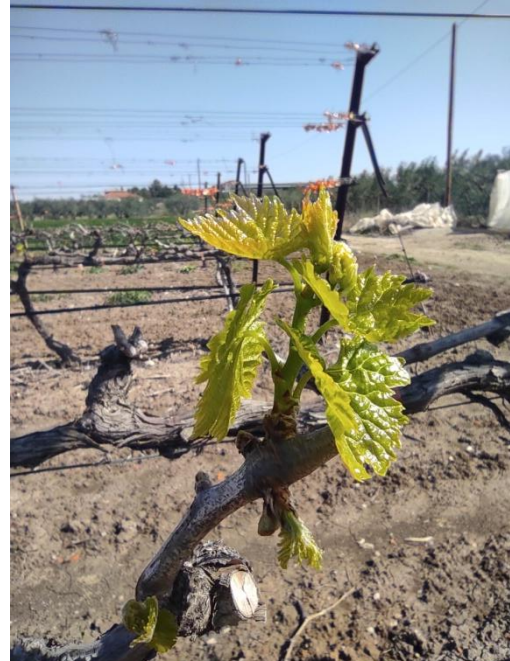
Αμπέλι στον Άγιο Παύλο Χαλκιδικής