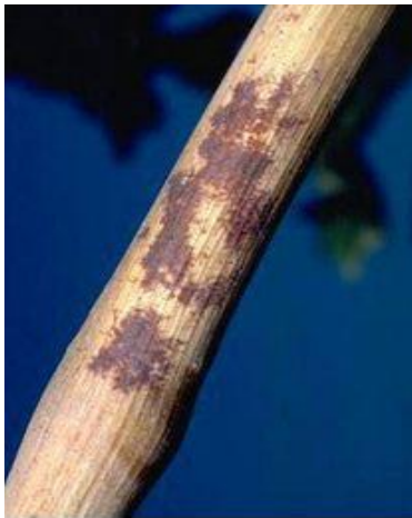
Κληματίδες με σκουρόχρωμες δικτυώσεις