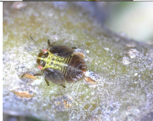
Προνύμφες τελευταίων σταδίων