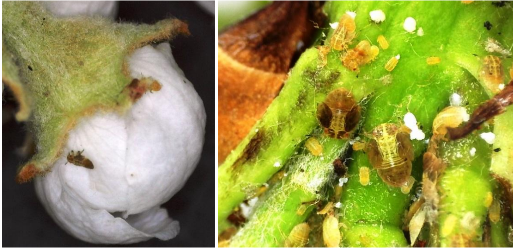
Αυγά και προνύμφες Cacopsylla pyri σε ταξιανθίες

Κατά την επιλογή του Φυτοπροστατευτικού Προϊόντος, να δοθεί ιδιαίτερη προσοχή στον τρόπο και χρόνο εφαρμογής.