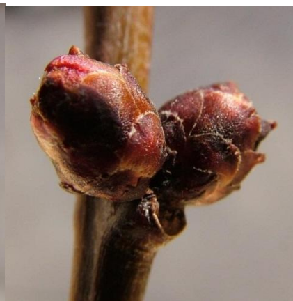
Εικόνα 2. στάδια ΒΕΡΙΚΟΚΙΑΣ