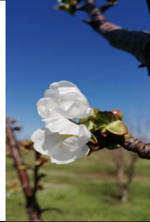
Λευκή κορυφή – Έναρξη άνθησης